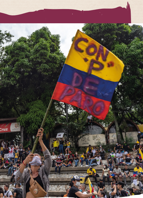
Plantón en el marco del Paro Nacional - Cali, Colombia, 2021.