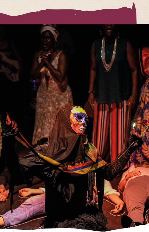
Performance Madre Ya Regreso en el marco de la puesta en escena de la serie audiovisual, El Paro Nacional - Cali, Colombia, 2021.