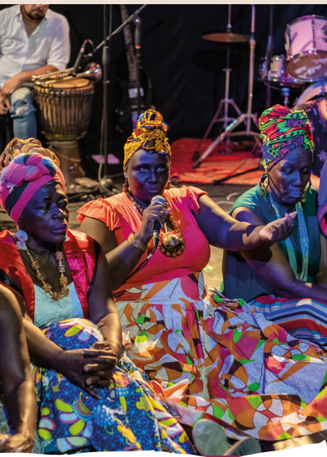
Grupo Comadreo por la Vida en el marco del conversatorio de la puesta en escena de la serie audiovisual, El Paro Nacional - Cali, Colombia, 2021.

Así fue como iniciamos la producción y creación colectiva de la serie El Paro Nacional. La primera semana del Paro, cuando aún no sabíamos todo lo que viviríamos en los meses venideros, surgió en tiempo real, el primer capítulo: